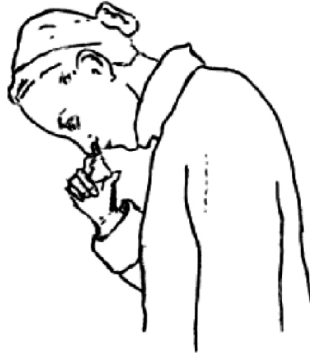
Figura 5. Modalità corretta per l'utilizzo degli steroidi topici nasali. Da voce bibliografica 53, modificato.